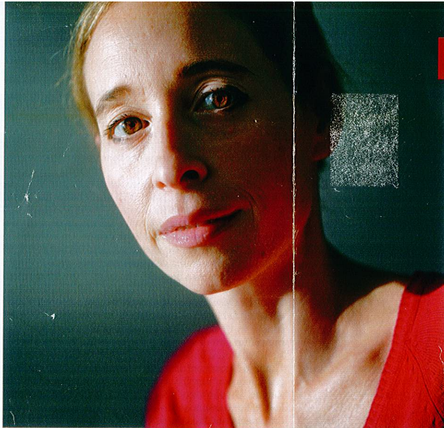
L'economista Noreena Hertz, ha scritto Eyes Wide Open , inno al pensiero critico.