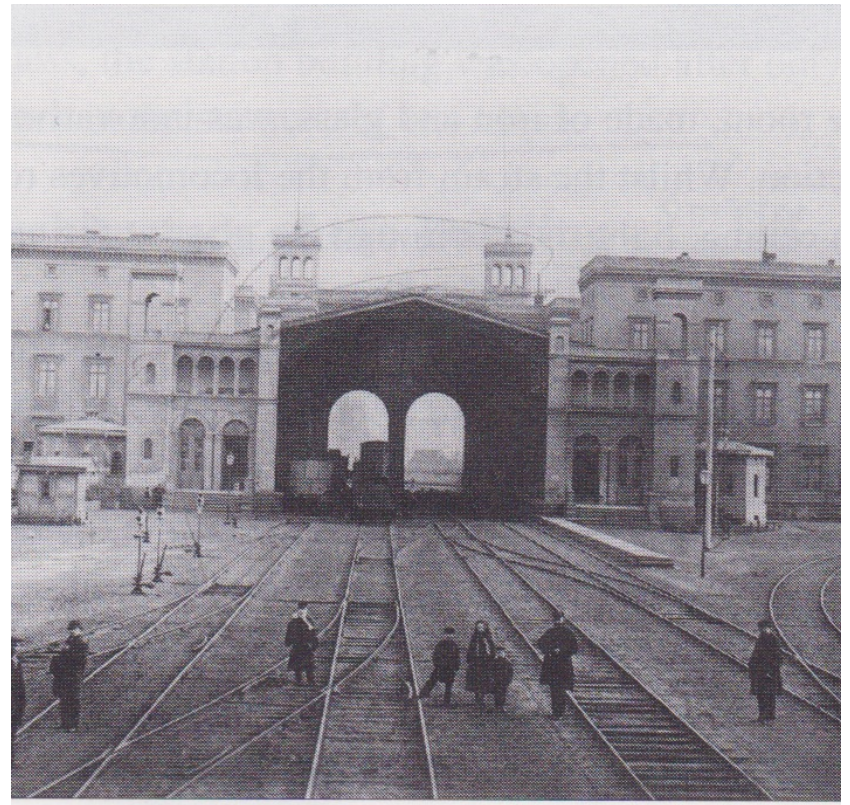
Veduta della hall intorno al 1865