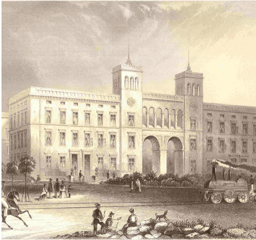
Veduta della facciata intorno al 1850