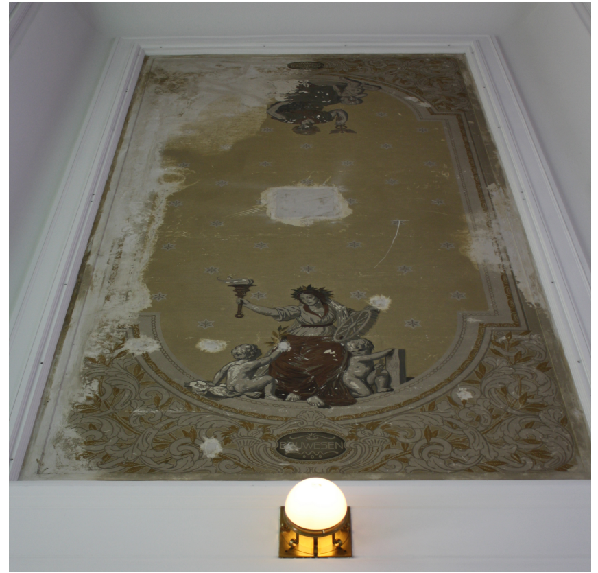
Allegoria dell'architettura Ala Est