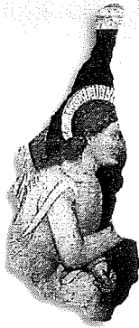
particolare dell'affresco del XIV secolo in Santa Maria in Chiavica, sede del C.T.G.

Il corso, aperto a tutti, approfondisce la conoscenza di Verona e della sua storia