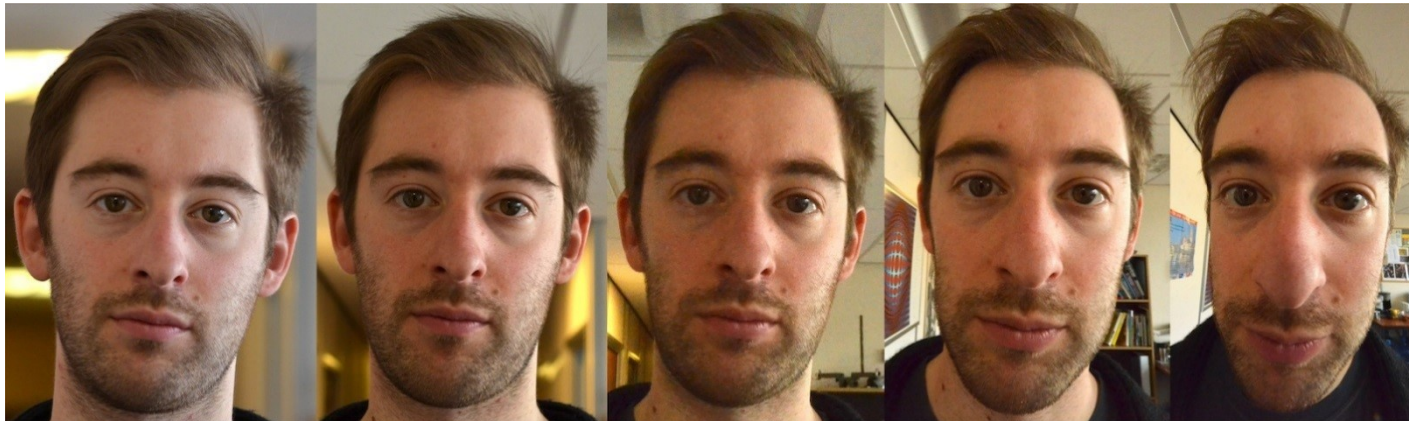
85mm @ 200cm